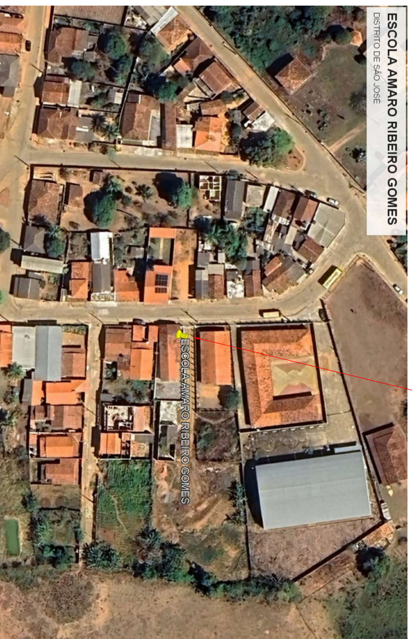
PROJUI LOCALIZAÇÃO (B) Escola Amaro Ribeiro Gomes

B Látuda >> -20,28/75 pass Largura >> -40,28/119 pass