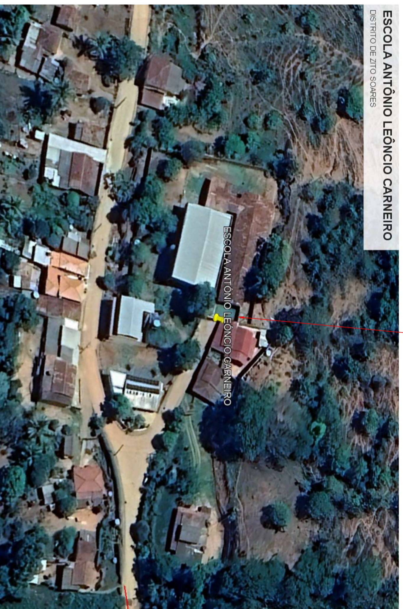
PROJUI LOCALIZAÇÃO (A) Escola Antônio Leônicio Carneiro

A Látuda >> -20,10/813 pass Largura >> -40,28/119 pass