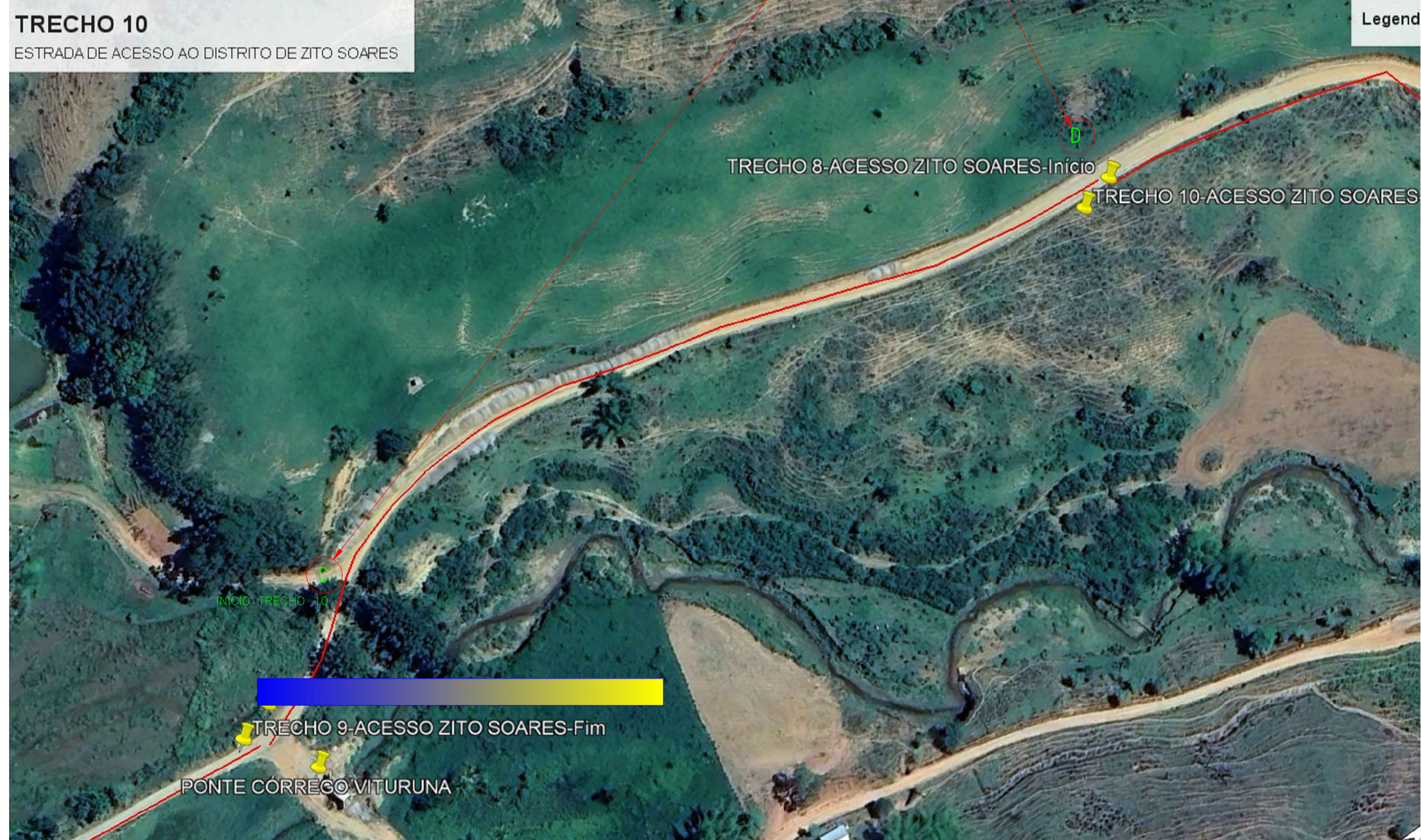
LOCALIZAÇÃO - Trecho IO - Estrada acesso ao Distrito de Zito Soares SEM ESCALA

C Latitude >> -20,206713 Longitude >> -42,769728 D Latitude >> -20,206713 Longitude >> -42,769728