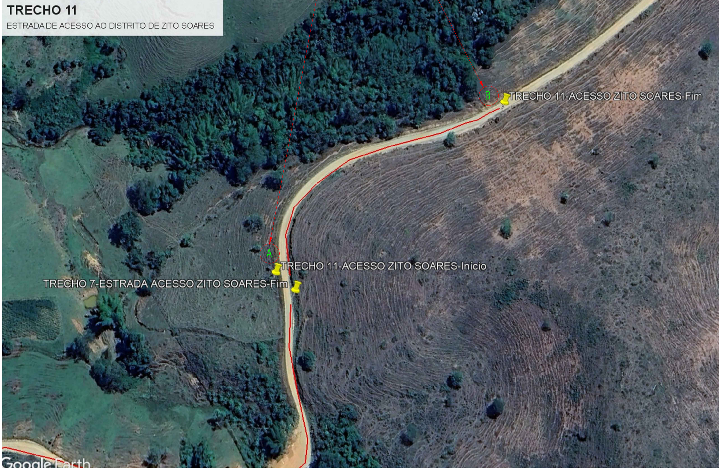
LOCALIZAÇÃO - Trecho II - Estrada acesso ao Distrito de Zito Soares SEM ESCALA

A Latitude >> -20,228250 Longitude >> -42,800674 B Latitude >> -20,227212 Longitude >> -42,799210