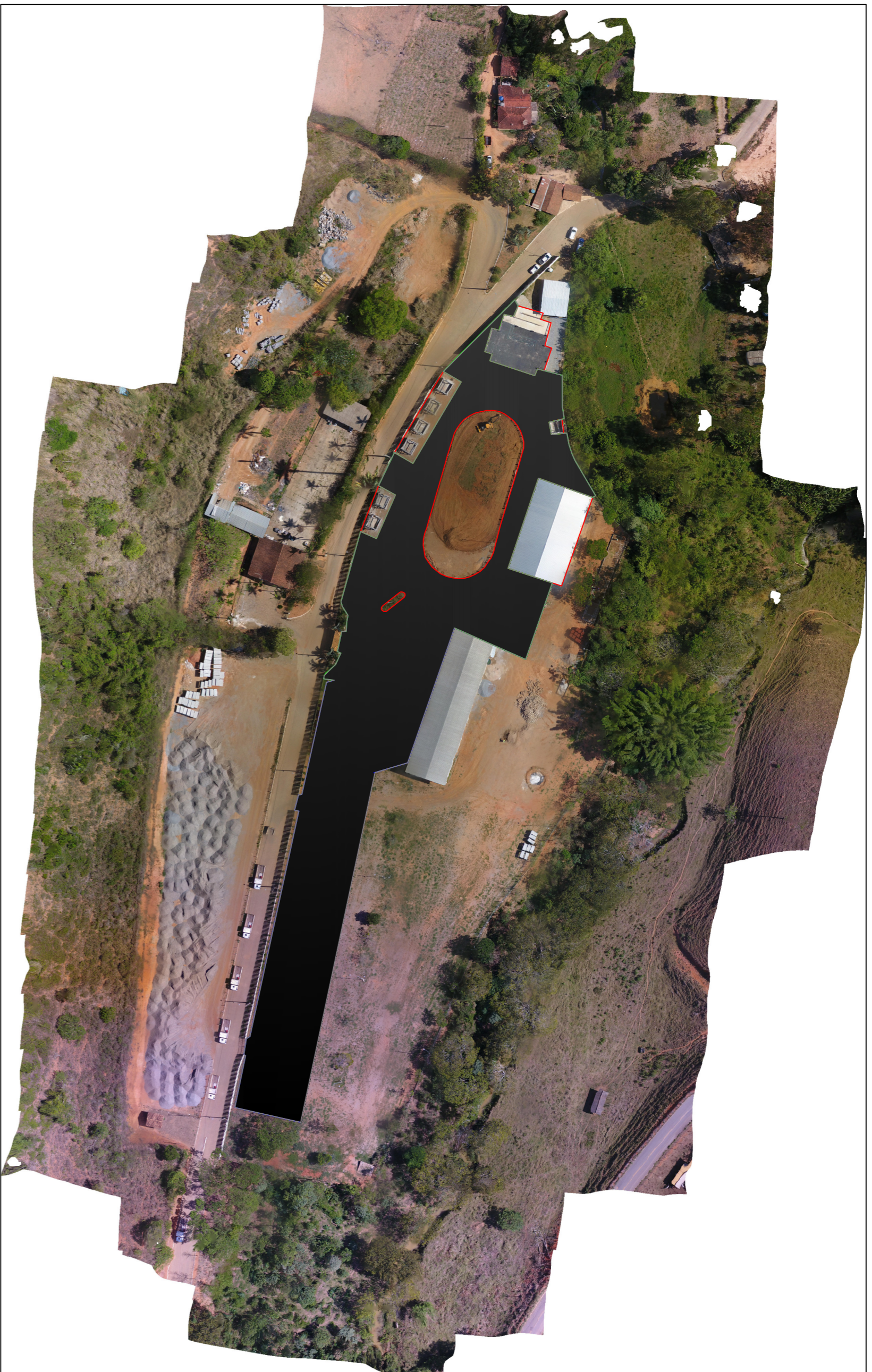
ORTOFOTO SEM ESCALA