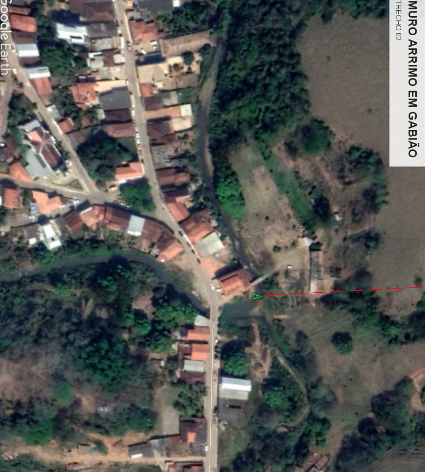
LOCALIZAÇÃO SEM ESCALA